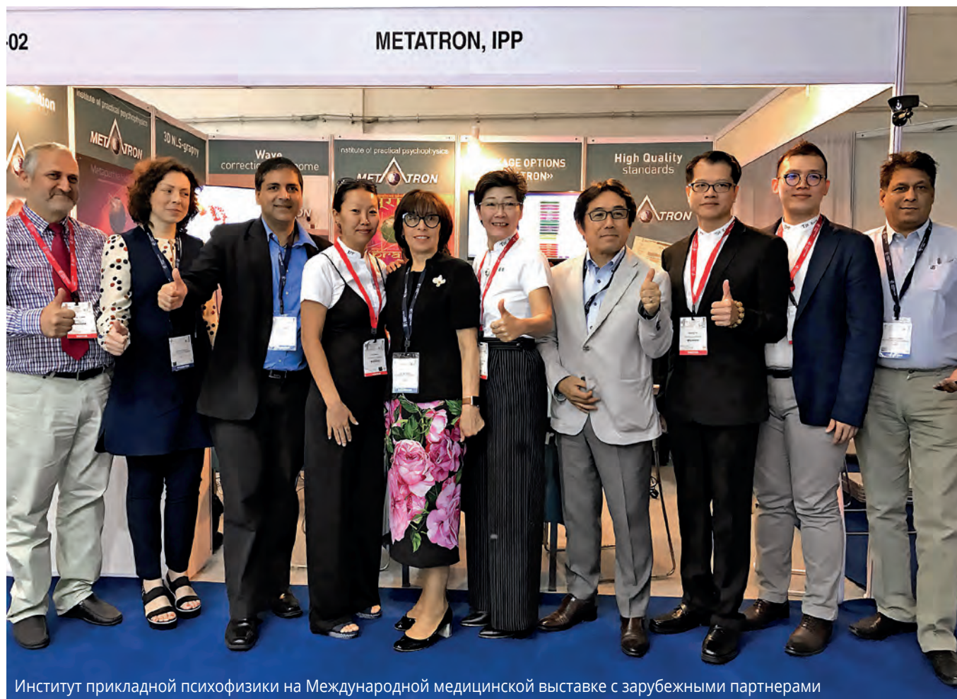
Институт прикладной психофизики на Международной медицинской выставке с зарубежными партнерами

чить максимальный объем информации о дисфункциональных изменениях в организме.