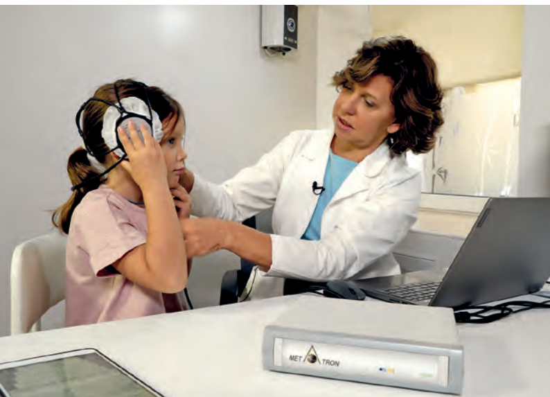
Диагностика на аппаратно-программном комплексе «Метатрон»