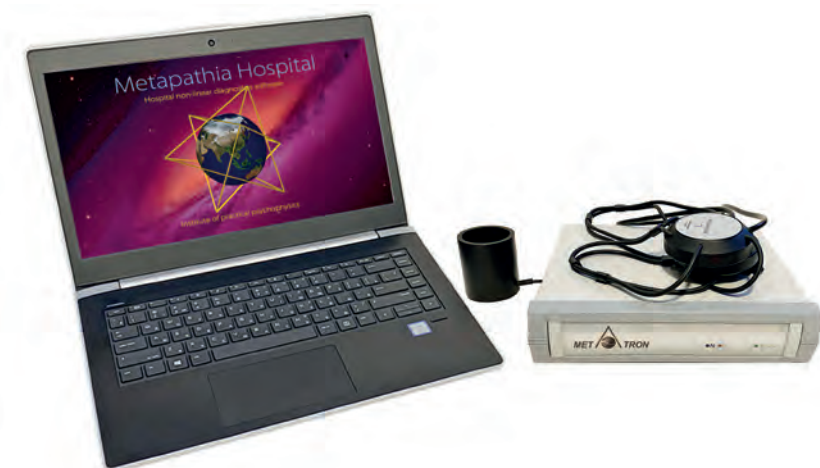
Аппаратно-программный комплекс «Метатрон»

в области биорезонанса Института прикладной психофизики. Немногие могут позволить себе подобную верификацию своих технологий. Мы убедились, что метод биорезонанса прекрасно идентифицирует зрелые процессы в организме, которые подтверждались с помощью классической диагностики. Но прежде чем любое заболевание проявит себя, оно проходит шесть стадий развития, и, если заметить его на первых пяти стадиях, человек останется здоровым. К сожалению, традиционные методы диагностики не способны на это, а наша разработка видит еще не проявленные заболевания. Поэтому мощный превентивный потенциал «Метатрона» — первое, на что бы я обратила внимание. Второе — колоссальная программа визуализации, которая заложена в аппарате. Я убеждена в том, что основное предназначение врача не лечить болезнь, а научить